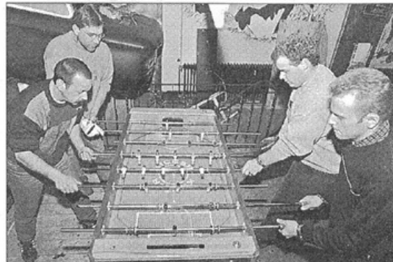
Der richtige Dreh.

A nsonsten hat Kickern viel mit dem richtigen Fußball zu tun. Es gibt eine erste und zweite Bundesliga, mit Hin- und Rückrunde; Auf- und Abstieg inklusive. Der deutsche Meister wird an zwei Wochenenden ermittelt. Eines haben fast alle Kicker-Vereine gemeinsam: Sie kommen vom Dorf. Im Oberhaus (16 Mannschaften) trifft beispielsweise der TFC Kleinwallstadt auf den TFC Kleinzimmern, im Unterhaus (neun Mannschaften) Fortuna Spiesen eben auf den Kicker-Club Kerken.